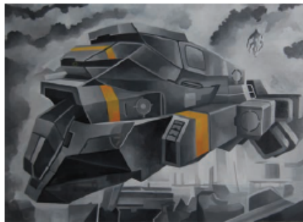
Svemirski brod 1 , ulje na platnu, 196x130cm