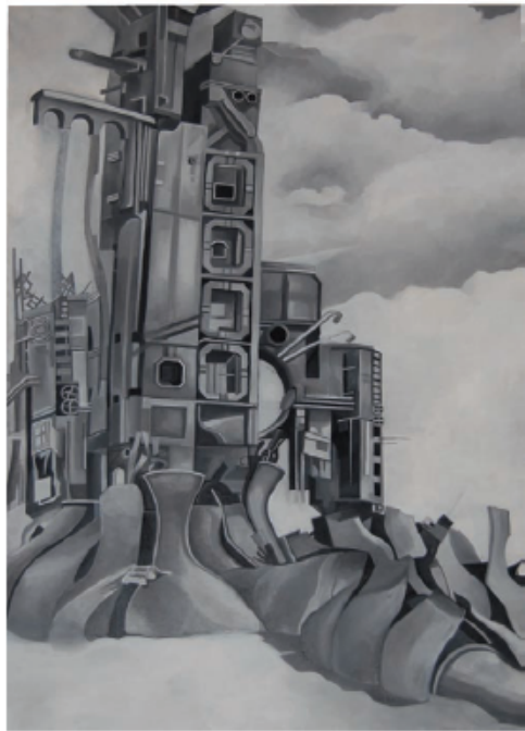
Mrtvi grad , ulje na platnu, 130x196cm