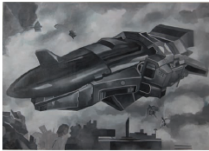
Svemirski brod 2 , ulje na platnu, 196x130cm