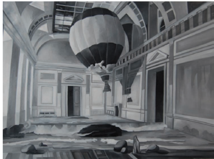
Balon , ulje na platnu, 196x130cm